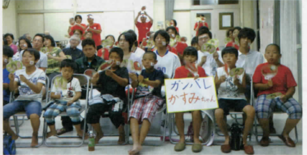
地域交流センターにて

後 援会は、試合をみながら観戦・応援できるよう、パブリックビューイングを開催しました。ロンドンとの時差により、日本では深夜の観戦となりましたが、シングル戦4回、団体戦3回を開催し、延べ1400人が来場し、応援しました。また、父母会では、パブリックビューイング開催にあたり、準備・片付け等を行い、盛大な応援で会場を盛り上げました。