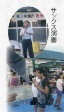
指出夏まつり 8月19日