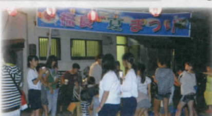
福良自治会夏まつり 8月18日