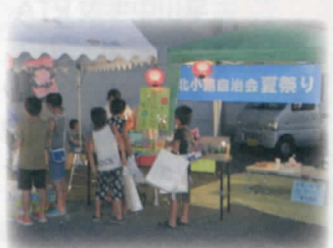
北小路夏まつり 8月25日