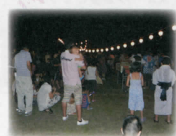
吉田地区盆おどり大会 8月15日

28年目を迎える吉田地区盆踊り大会は、今年も強力な有志の力と、賛同し参加する住民により、盛大に開催されました。