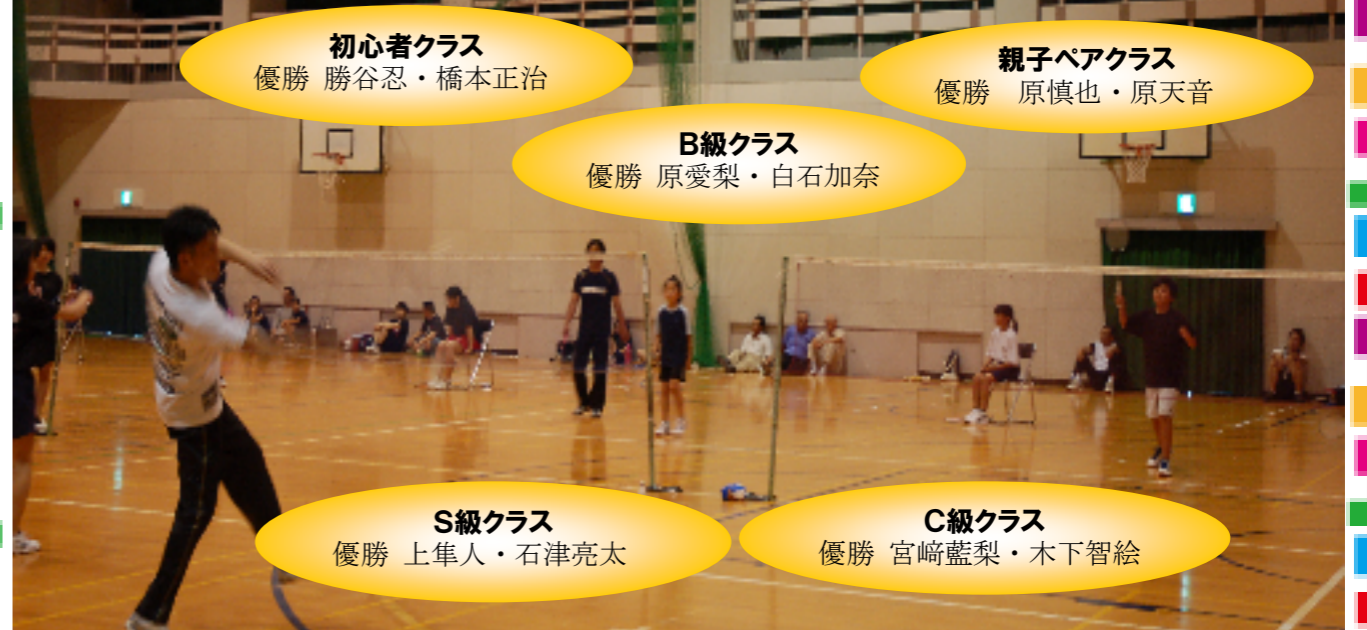
主催：平川生活体育振興会、平川地域交流センター