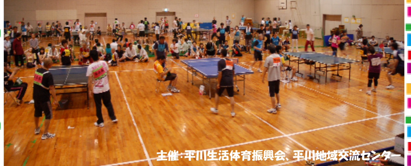
主催：平川生活体育振興会、平川地域交流センター